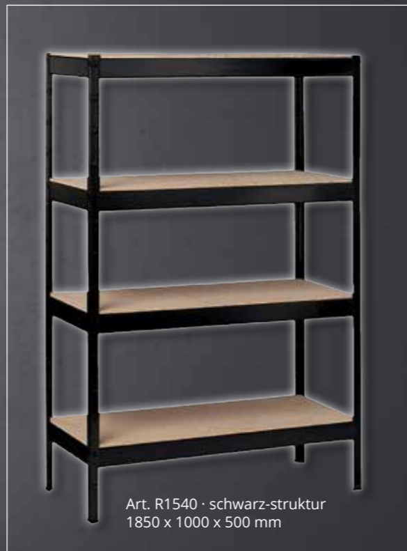
Art. R1540 · schwarz-struktur 1850 x 1000 x 500 mm